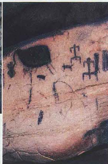
È l'entrata della Grotta del Genovese e, qui accanto, un particolare delle pitture rupestri al suo interno

lungo il costone sino alla grotta, nascosta in basso a sinistra. La vegetazione, rada, è quella tipica dell'isola, con larghe macchie di lentisco circondate da Euforbia dendroides, cisto, senecio.