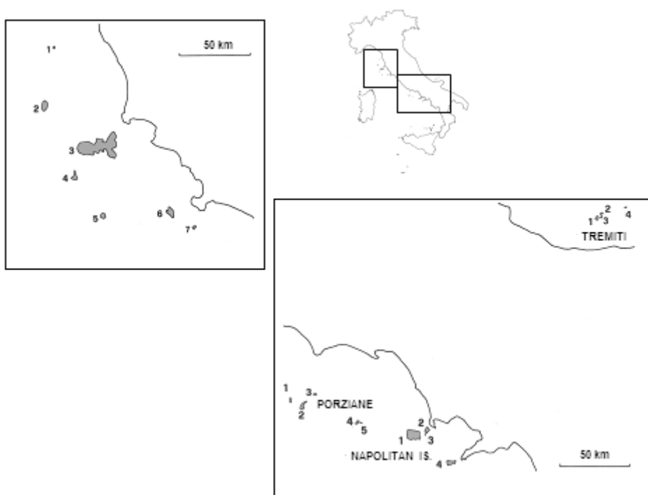
Figure 2 - Tuscan archipelago : 1 = Gorgona; 2 = Capraia; 3 = Elba; 4 = Pianosa; 5 = Montecristo; 6 = Giglio; 7 = Giannutri. Tremiti islands : 1 = San Domino; 2 = Caprara; 3 = San Nicola; 4 = Pianosa. Isles of the gulf of Naples (Napolitan Is.) : 1 = Ischia; 2 = Procida; 3 = Vivara; 4 = Capri. Ponziane islands : 1 = Palmarola; 2 = Ponza; 3 = Zannone; 4 = Ventotene; 5 = Santo Stefano.

on Ustica, where an individual was observed for a few months in 1994 (Sarà, 1998).