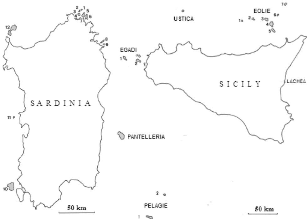
Figure 1 - Sardinian isles: 1 = Santa Maria; 2 = Razzoli; 3 = Budelli; 4 = Spargi; 5 = La Maddalena; 6 = Caprera; 7 = Santo Stefano; 8 = Tavolara; 9 = Molara; 10 = San Pietro; 11 = Mal di Ventre; 12 = Asinara. Eolie islands: 1 = Alicudi; 2 = Filicudi; 3 = Salina; 4 = Lipari; 5 = Vulcano; 6 = Panarea; 7 = Stromboli. Egadi islands: 1 = Marettimo; 2 = Favignana; 3 = Levanzo. Pelagie islands: 1 = Lampedusa and Isola dei Conigli; 2 = Linosa.

The only species of this order found, until now, on Italian islands is Erinaceus europaeus (Erinaceidae). It is present on Alicudi, where it was introduced in the second half of the 20 th century (Cristaldi et al. , 1987). Occasional presence was also recorded on Favignana, Egadi Islands, with a specimen found dead in 1989 (Sarà, 1998) and